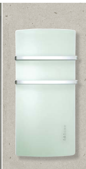
DEVA Wit glas