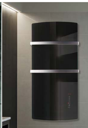
DEVA Zwart glas