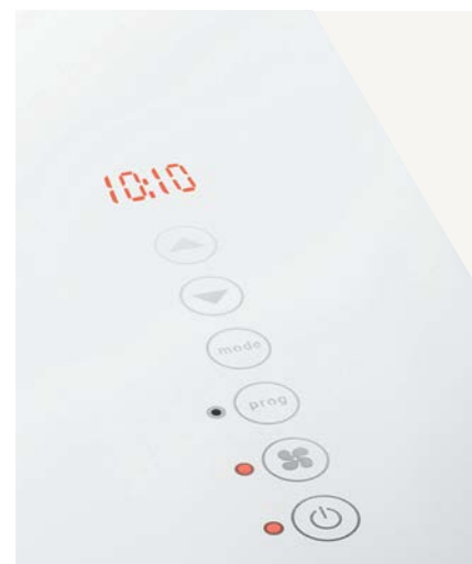
DEVA met tiptoetsbediening

De DEVA radiatoren zijn leverbaar in de hoogtemaat 1050 mm en in de breedtemaat 520 mm. Leverbaar in de kleuren wit, spiegel of zwart glazen warmtepaneel.