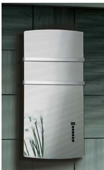
E-Comfort DEVA Spiegel

E-Comfort DEVA Wit glas met tiptoetsbediening