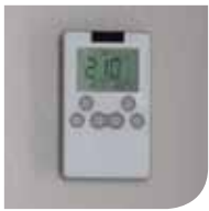
Eenvoudig te hanteren afstandsbediening.