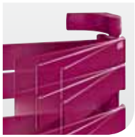
Draaibare, platte radiator.

Zehnder Roda Air met "Twist"-functie: dankzij de 180° draaibare radiator kunnen badhanddoeken vlot worden opgehangen. De geïntegreerde, krachtige verwarmingsventilator fungeert als extra "booster" om de badkamer nog sneller te verwarmen.