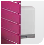
Geïntegreerde, krachtige verwarmingsventilator.