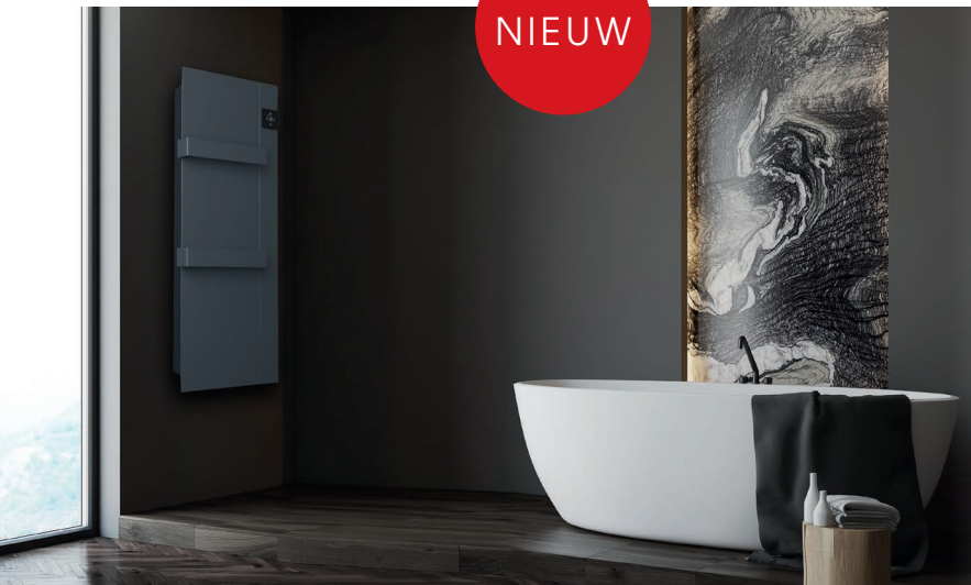
E-Comfort ONSEN: Mat gestructureerd grijs RAL 7024