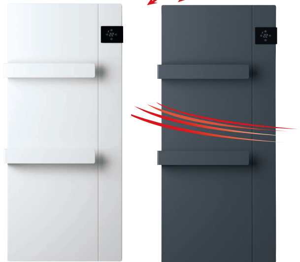
ONSEN: Mat gestructureerd wit RAL 9003 en grijs RAL 7024 Dual Therm technology: Stralingswarmte + natuurlijke convectie